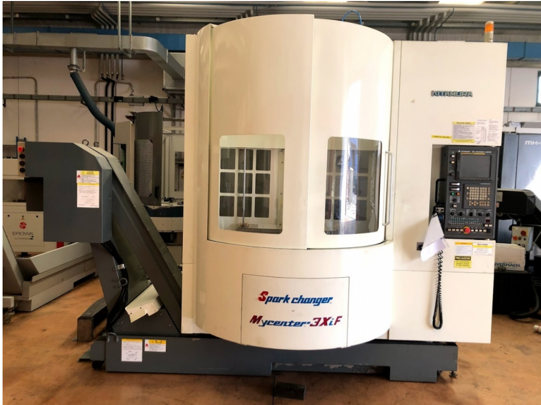
Foto zona di lavoro