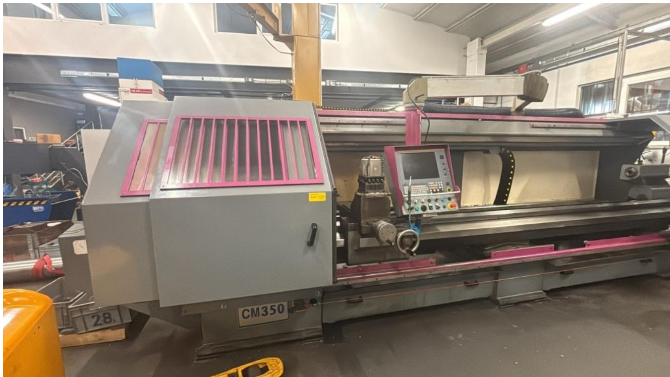
Foto zona di lavoro